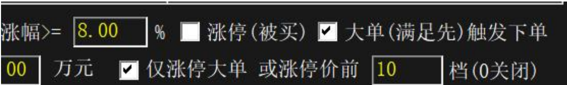
图 4 仅使用涨停价作为大单价格定义

图 4 中 仅涨停价大单 勾选后就只处理涨停价的主买大单,涨停价前 10 档无效,8%涨幅定义也无效。